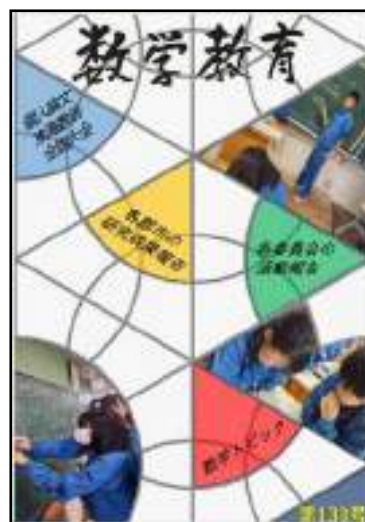
【機関誌「数学教育」令和7年度号】